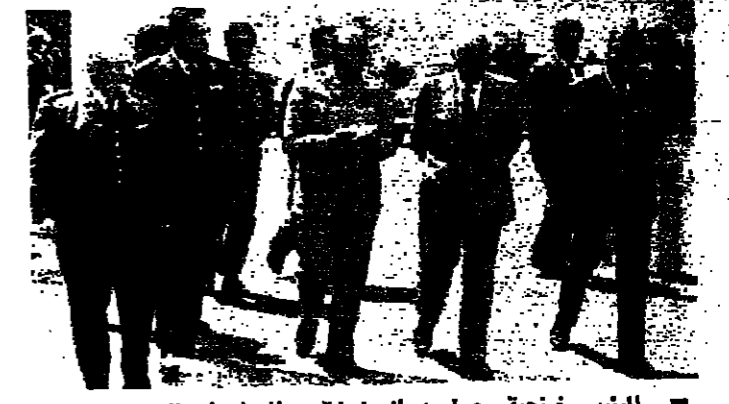
الرئيس فرنجة يحيط به المندوبون والمندوبون في بيروت

كان مشروع تنظيم الجيش ويضم كلاً من القوات المسلحة والقوات الشعبية في إطار تنظيم الجيش الوطني، وهو من إعداد الرئيس فرنجة، وقد تم عرضه في اجتماعات المجلس الأعلى في بيروت في ١٢ آب ١٩٧٥. وقد وافق المجلس على المشروع في ١٤ آب ١٩٧٥. ويتميز المشروع بـ ٧ أعضاء يمثلون جميع الطوائف اللبنانية، وهو من إعداد الرئيس فرنجة، وقد تم عرضه في اجتماعات المجلس الأعلى في بيروت في ١٢ آب ١٩٧٥. وقد وافق المجلس على المشروع في ١٤ آب ١٩٧٥.